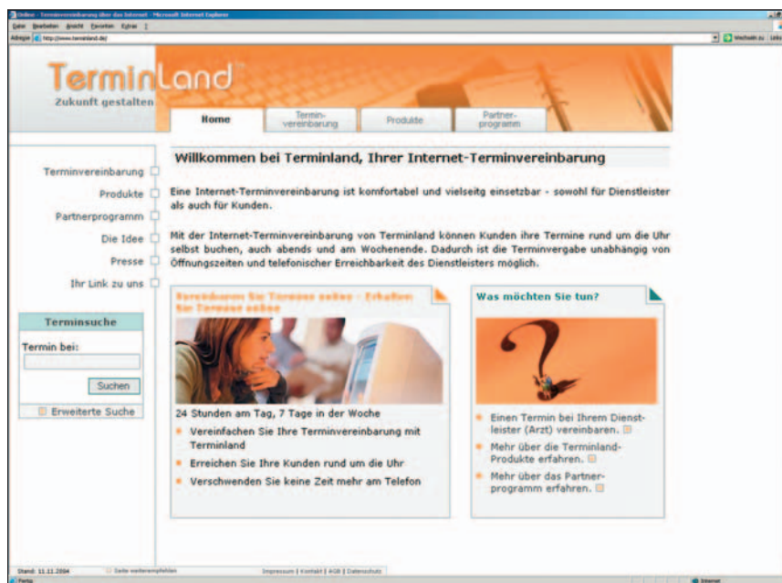
Wie eine Online-Terminvereinbarung abläuft, kann man im Internet bei Anbietern studieren, zum Beispiel bei Terminland: www.terminland.de

Auch die eingangs erwähnten Frankfurter Gynäkologinnen hatten diese Bedenken, als sie sich entschlossen, ein Online-Buchungssystem zu installieren. Mittlerweile ist die Skepsis allerdings verflogen: „Bei den Online-Buchungen fallen nicht mehr Termine ins Wasser als bei Telefonbuchungen“, sagt Arzthelferin Manthey. Gute Ideen sollte man nicht schlechtreden, sondern sie einfach mal ausprobieren.